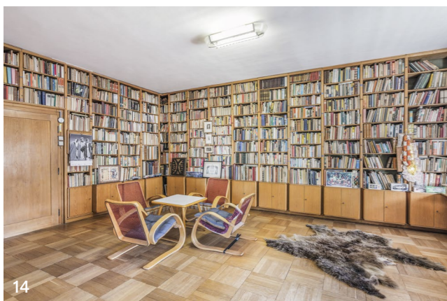
14 Náš tip: Nejzajímavější cestovatelský budoár