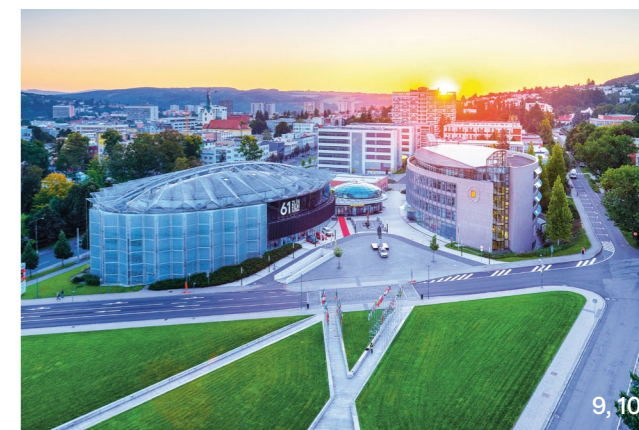
9, 10 Náš tip: Největší rozsívka