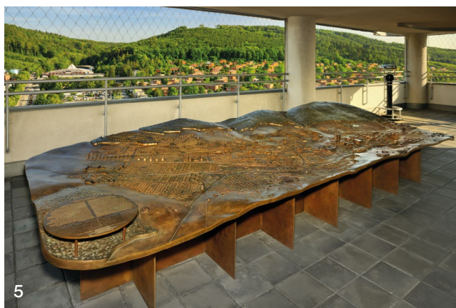
5 Náš tip: Nejlepší vyhlídka