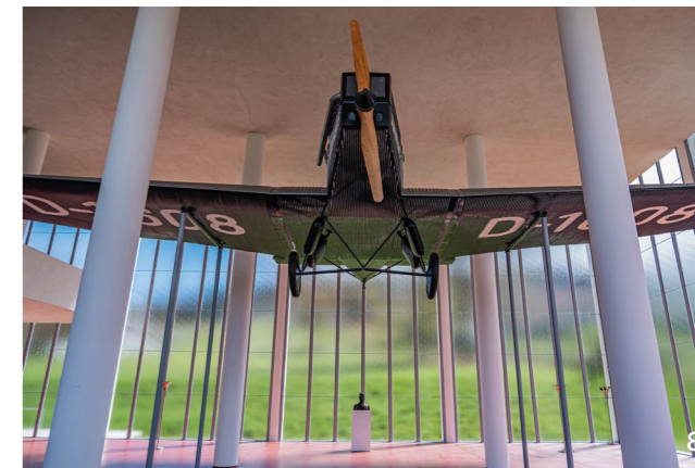
8 Náš tip: Nejfotogeničtější interiér