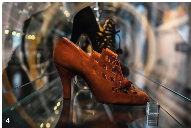
4 Náš tip: Největší sbírka obuvi ve 14|15 BAŤOVĚ INSTITUTU