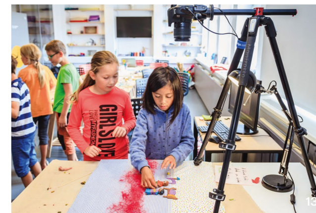
13 Náš tip: Nejtvůrčivější centrum pro celou rodinu