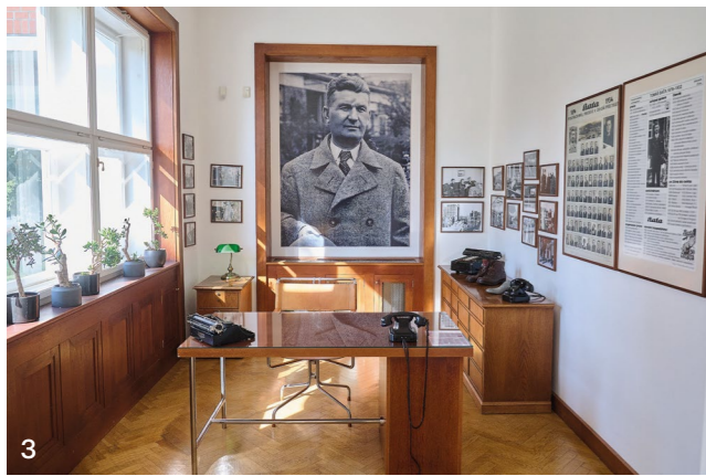
3 Náš tip: Kancelář nejvýznamnějšího člověka ve Zlíně